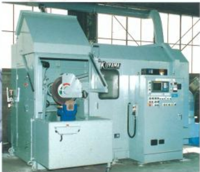
自動パリ取りロボット●AGN-4N-F15-600USP